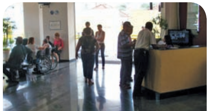
Para funcionar, o HHA custa R$ 1 milhão e 700 mil/mês

Outro pedido está em tramitação no Ministério da Saúde desde novembro/2010, aguardando resposta das autoridades federais.