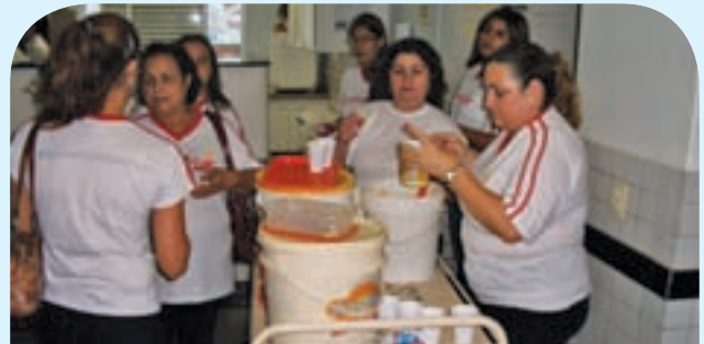
O caldo é distribuído gratuitamente

A s páginas do Jornal Salve Vidas são insuficientes para registrar os nomes de todas as pessoas que nos últimos 50 anos ajudaram e ajudam a manter o Hospital Dr. Hélio Angotti. Muitos preferem o anonimato. O JSV pinçou exemplos para ilustrar a maneira como muitos têm colaborado.