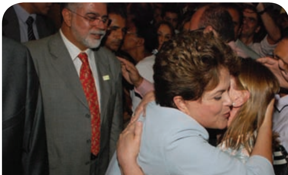
Presidente Dilma Rousseff teve câncer linfático

O subfinanciamento do SUS é o grande dilema, mas não desanima a direção.