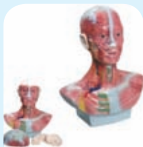
Aparelhos preservam função e estética

D ois tipos de intervenções cirúrgicas realizadas no Hospital Dr. Hélio Angotti ganharam reforço tecnológico no mês março.